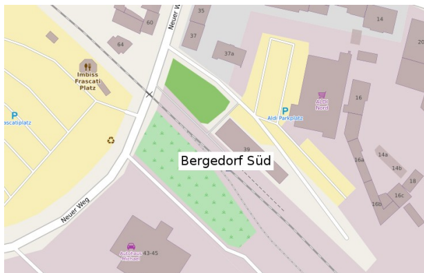
Bahnhof Bergedorf Süd : Hamburg, Neuer Weg 39

In allen Zügen bieten wir einen Getränkeservice mit Erfrischungsgetränken und Kaffee. Im Lokschuppen in Geesthacht erhalten Sie Kaffee und Kuchen sowie heiße Wurst.