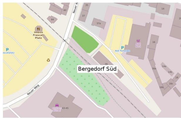
Bahnhof Bergedorf Süd : Hamburg, Neuer Weg 39

In allen Zügen bieten wir einen Getränkeservice mit Erfrischungsgetränken und Kaffee. Im Lokschuppen in Geesthacht erhalten Sie Kaffee und Kuchen sowie heiße Wurst.