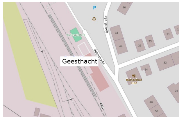
Bahnhof Geesthacht : Geesthacht, Bahnstr. 45

Die Arbeitsgemeinschaft Geesthachter Eisenbahn e.V. wurde 1975 gegründet. Mehrere alte BGE - Wagen konnten in ganz Deutschland aufgespürt, überführt und aufgearbeitet werden. Bereits 1976 rollte der erste Sonderzug auf der alten BGE - Strecke. Seit 1977 zog endlich auch eine Dampflok die historischen Wagen. 1981 konnte in Dänemark eine Dampflok der Baureihe „Q“ gekauft werden. Und weil eine dänische „Kuh“ nun einmal „Karoline“ heißt, wurde das ihr Name. Heute besitzt die GE 6 Lokomotiven und 17 Wagen.