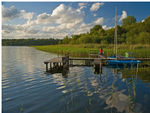
Der Schaalsee fasziniert mit seiner verträumten Idylle

Mitten im Schaalsee stehen dynamische Wälder aus Buchen, Fichten und Kiefern: alt und knorrig neben jung und frisch. Totholzbäume mit unzähligen Pilzen, holzfressenden Käfern und Wildbienen sind gut vom Weg aus zu sehen. Die feuchten Wiesen und Senken beherbergen Nässe-spezialisten wie z.B. Sumpfdotterblume und Roterle. Kraniche brüten geschützt in vernässten Waldsenken, Ringelnattern