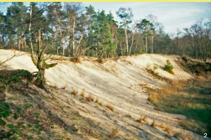
2 Große Düne im Kernbereich des Naturschutzgebietes

NATURA 2000 – Lebensräume erhalten und entwickeln