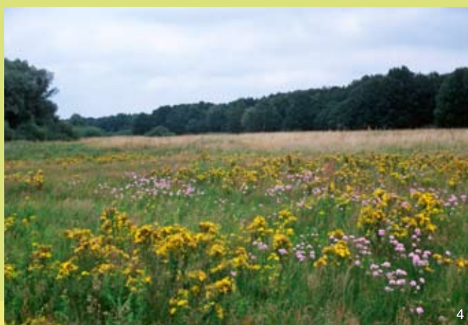
4 Sandtrockenrasen mit Grasnelke und Johanniskraut

Seit 1955, mit dem Bau der Geesthachter Schleuse, ist das Gebiet der natürlichen Dynamik eines Flusstales entzogen worden. Seitdem ist es nicht mehr dem direkten Hochwasser der Elbe ausgesetzt, so dass beispielsweise kaum noch offene Standorte auf natürliche Weise entstehen können.