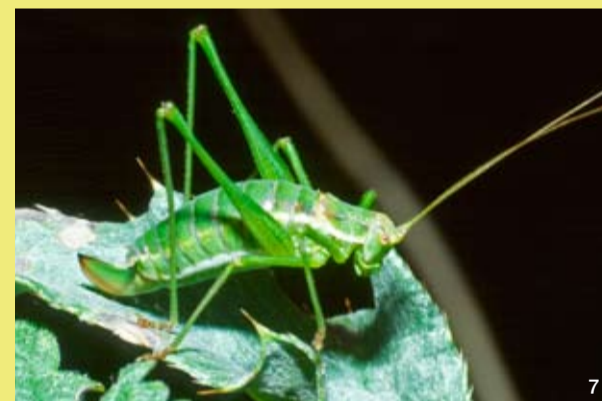
Weibchen der Gestreiften Zartschrecke

Die Gestreifte Zartschrecke hat hier das nordwestlichste derzeit bekannte Vorkommen Deutschlands. Sie ist auf warme, südexponierte Dünen und schütterere Pflanzenbestände mit Schafgarbe und Bibernelle angewiesen.