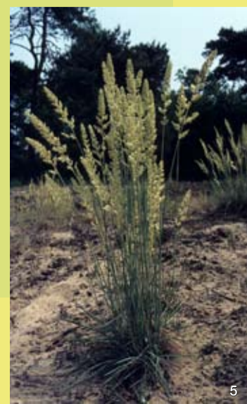
5 Düne mit dem Blaugrünen Schillergras

Um die Lebensräume der seltenen und gefährdeten Arten zu sichern, werden Pflegemaßnahmen durchgeführt, die eine vollständige Bewaldung der offenen Bereiche verhindern. Durch Beweidung oder Mahd und die Entwicklung naturnaher Wasserstandsverhältnisse sollen auch die Lebensgemeinschaften der Sandwiesen und Flutmulden erhalten werden.